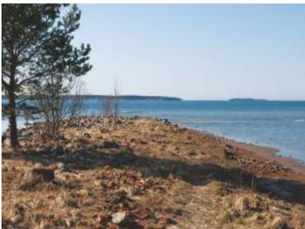
Siia tuleb sadam

Sadamat asub ehitama OÜ Monoliit. Sadama ehituseks on raha eraldanud PRIA.