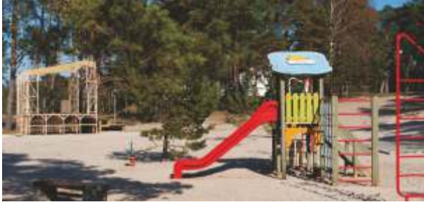
Võsu rand ootab suvitajaid uuendatud laululava ja mänguväljakuga

Randade ametlikuks avamisajaks on tänava esimene juuni, kuid vallavanema väitel olid rannad tunduvalt varem valmis küllastajaid vastu võtma ja seda mitte ainult Võsu rannas, milline ootab suvitajaid uuendatud laululava ja mänguväljakuga. Samuti on oodata uusi toilituskohti. Sel aastal korrastati ka Vergi ja Käsmu ujumiskohti. Laiendatud parkimisplatsi ja uue välikäimla sai Karepa rand. Seda kõike vallavalitsuse rahastamisel ja kohalike tegijate toel.