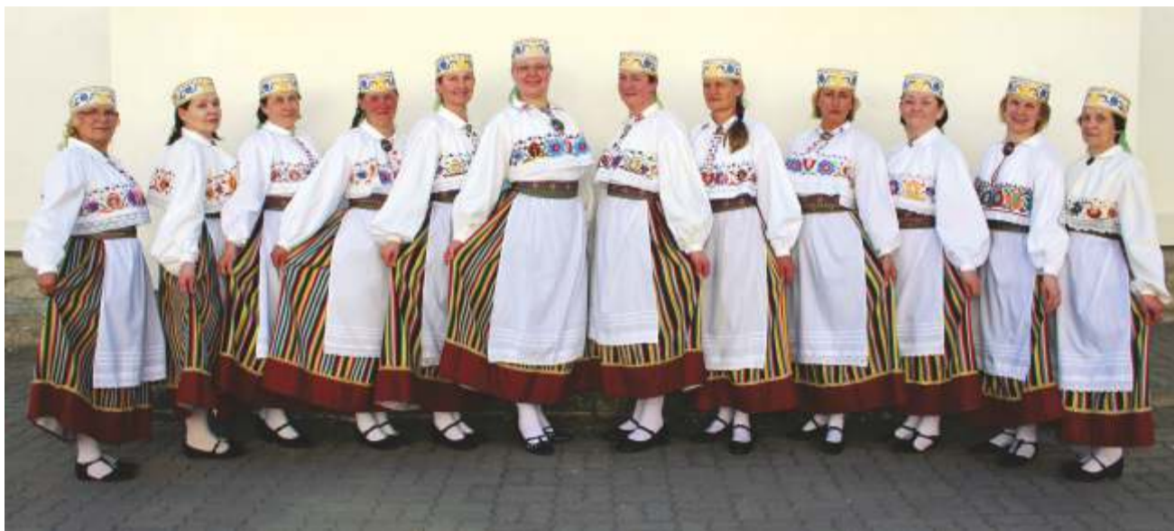
Võhma naisrahvatantsurühm Krõtaka