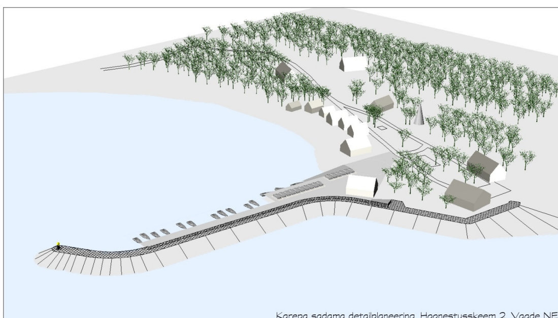
Karepa sadama detailplaneering. Hoonestuskeem 2. Vaade NE