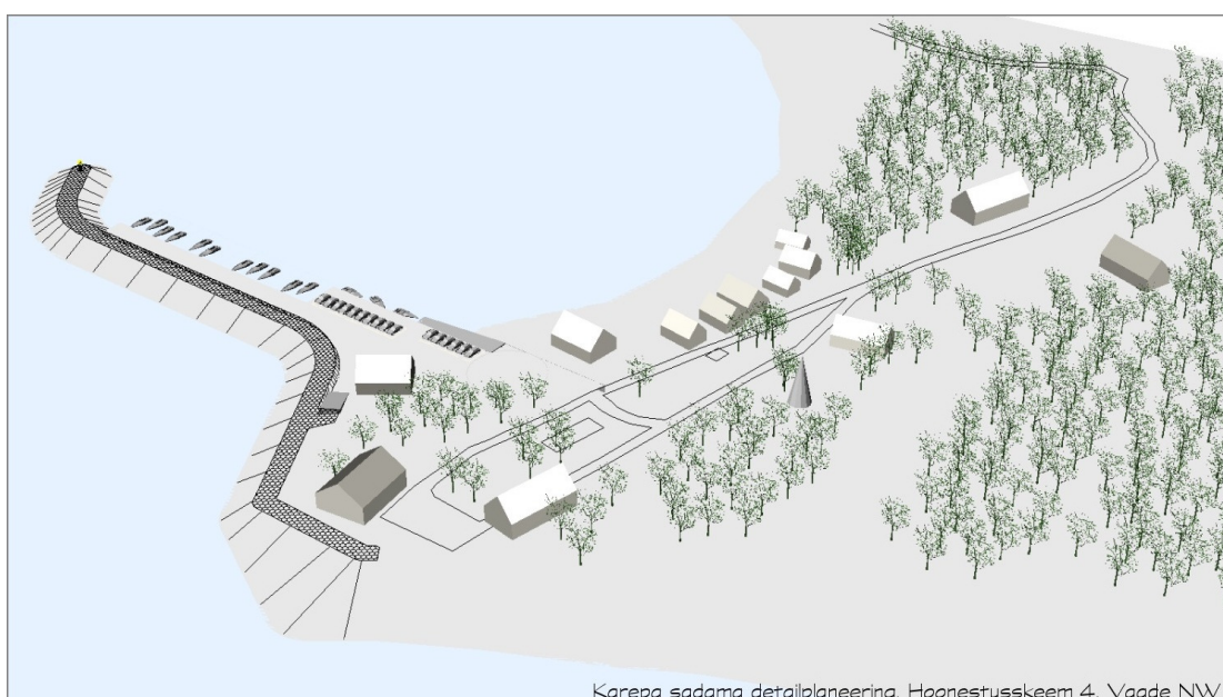
Karepa sadama detailplaneering. Hoonestuskeem 4. Vaade NW