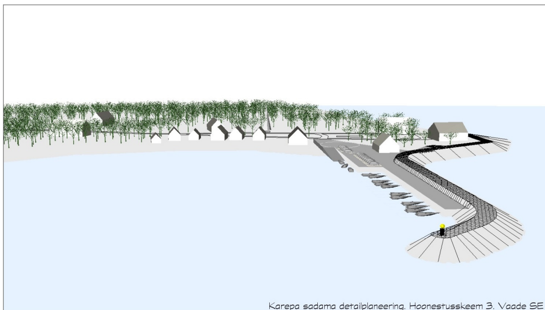
Karepa sadama detailplaneering. Hoonestuskeem 3. Vaade SE