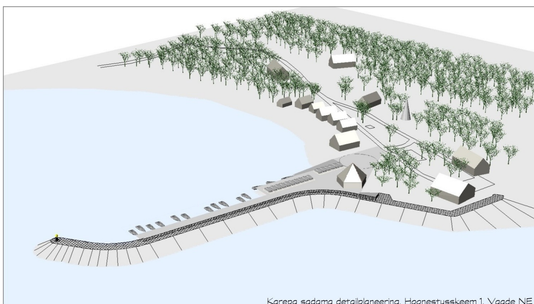
Karepa sadama detailplaneering. Hoonestuskeem 1. Vaade NE