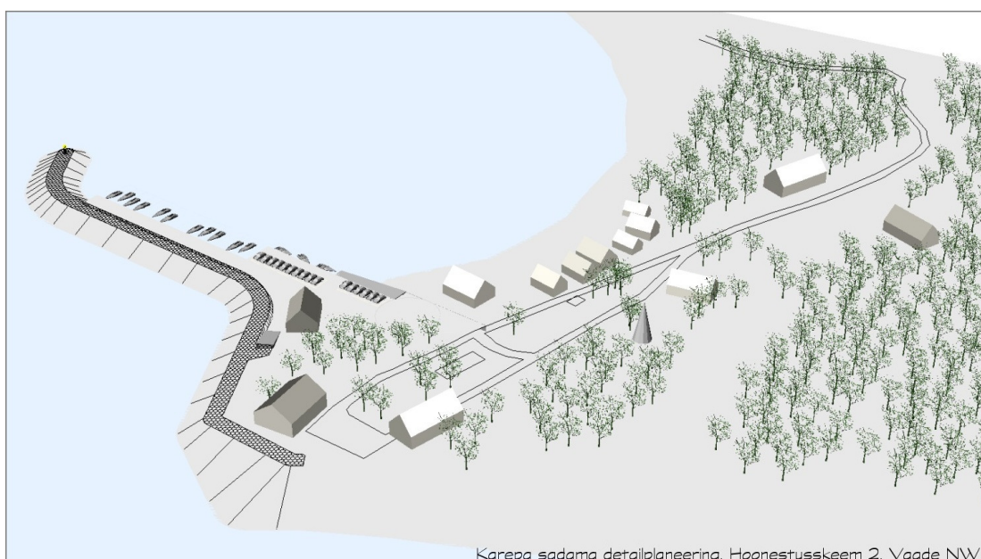
Karepa sadama detailplaneering. Hoonestuskeem 2. Vaade NW