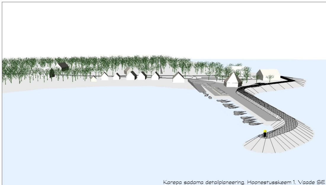
Karepa sadama detailplaneering. Hoonestuskeem 1. Vaade SE